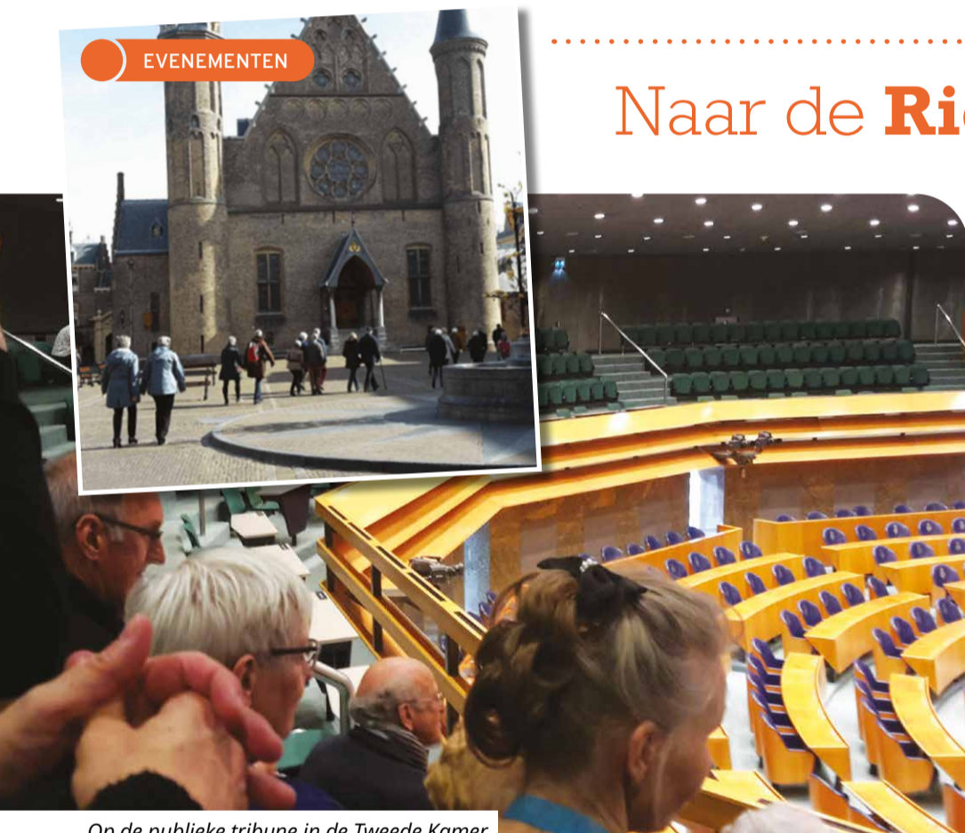
Op de publieke tribune in de Tweede Kamer

In maart organiseerde VO-ING Rayon Midden een tweede bezoek aan de Ridderzaal en Tweede Kamer. Zo'n 60 oud-collega's verzamelden zich 's morgens in bezoekerscentrum Prodemos nabij het Binnenhof, het historisch regeringscentrum van 'die Haghe'(Den Haag). Een korte wandeling voerde naar de oudste kelder van de Ridderzaal, waar een film werd vertoond over de Hollandse en Nederlandse politieke geschiedenis vanaf de 12e eeuw. De gids bracht ons hierna naar de gotische Ridderzaal met houten overkapping, die geconstrueerd was als omgekeerd houten schip zonder steunpilaren, voor bouwmeesters rond 1280 een prestatie van formaat. Halverwege de zaal stond de troon, waarop Koning Willem Alexander jaarlijks de troonrede uitspreekt.